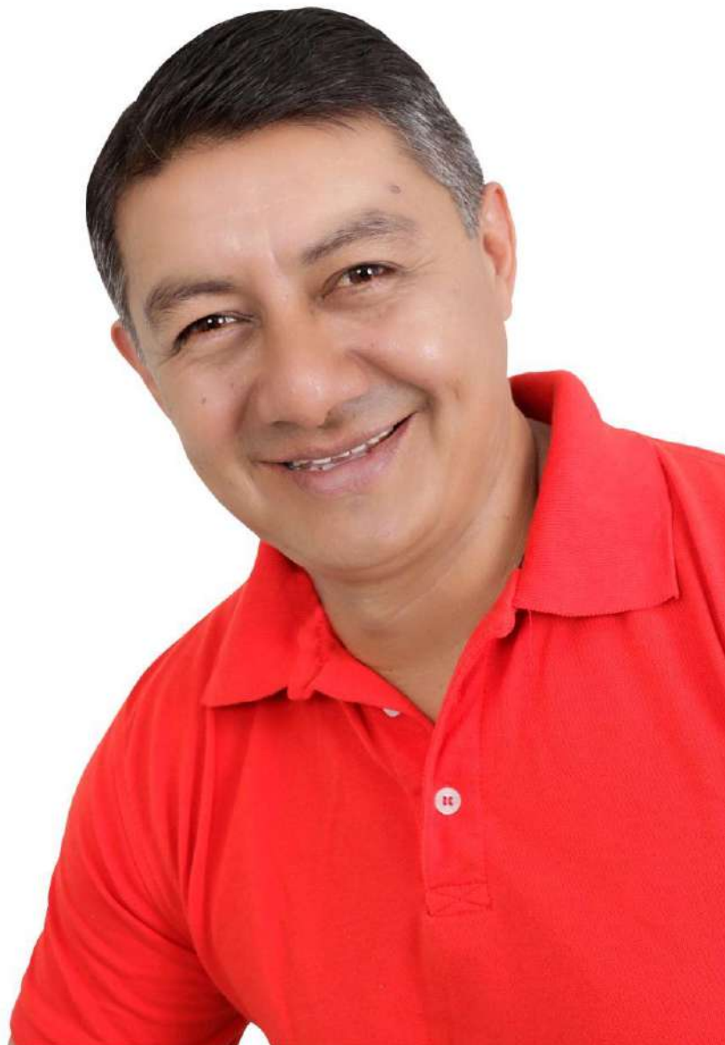
LIC. CARLOS ALONSO GUEVARA BARRERA CANDIDATO ALCALDE DE TENA