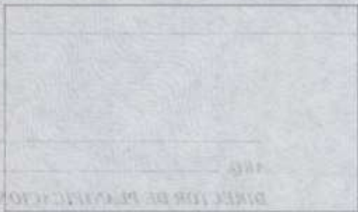
CROQUIS DE UBICACION

Firma del Propietario Nombre: C. Identidad: