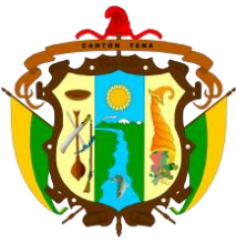
Gráfico No. 1