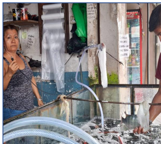
Fotografía 8 y 9. Local de venta de tilapias-bomba de recirculación de agua.