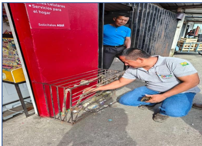
Fotografía 1. Verificación de medidores de agua potable.

Posteriormente, para verificar la continuidad o no del servicio de agua potable, procedimos a cerrar la llave de paso de cada medidor e ingresar a cada local para realizar la comprobación respectiva, como se detalla y evidencia con fotografías: