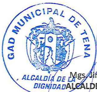
Mgs. Jimmy Reyes Mariño ALCALDE DE CANTÓN TENA