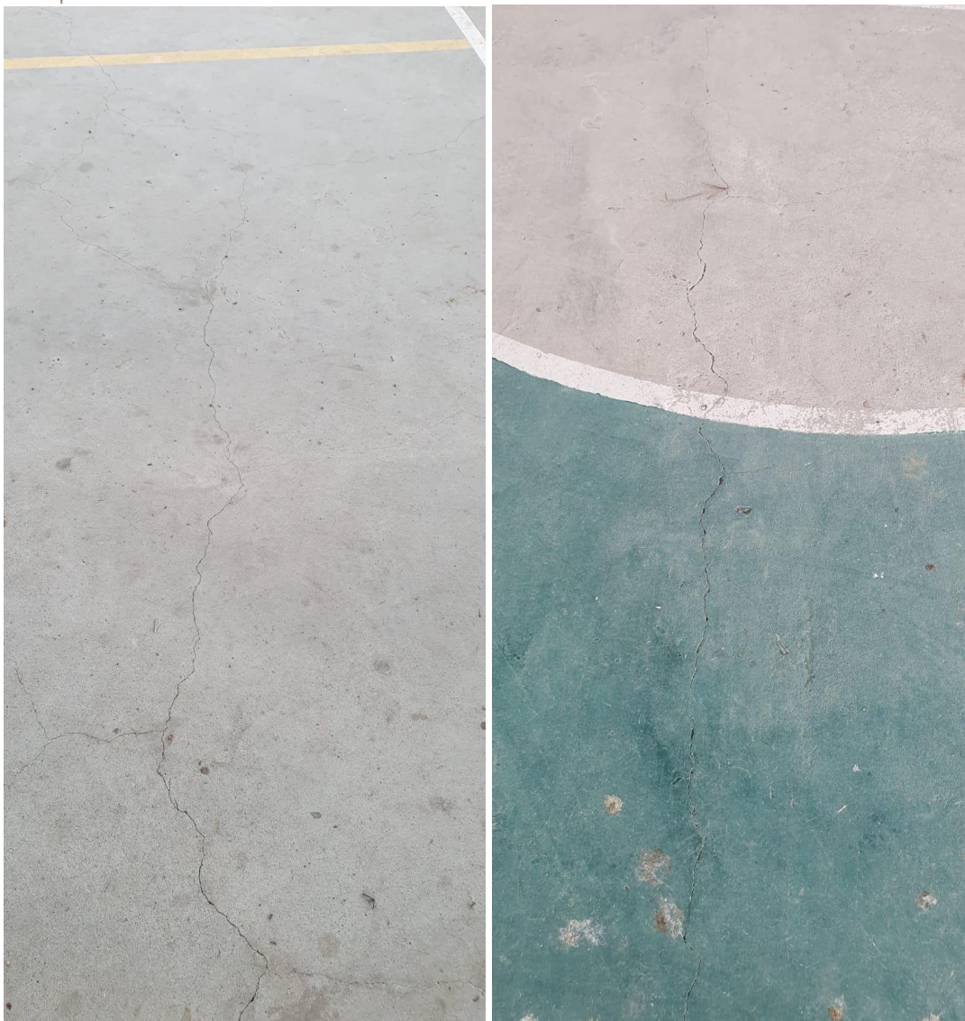
Existe fisuras en la cancha de barrio 3 de Mayo