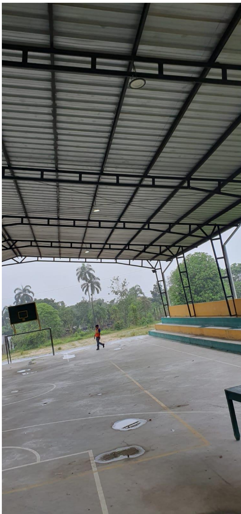
Se observa goteras, y lampara quemada cancha Pumayacu-Pano