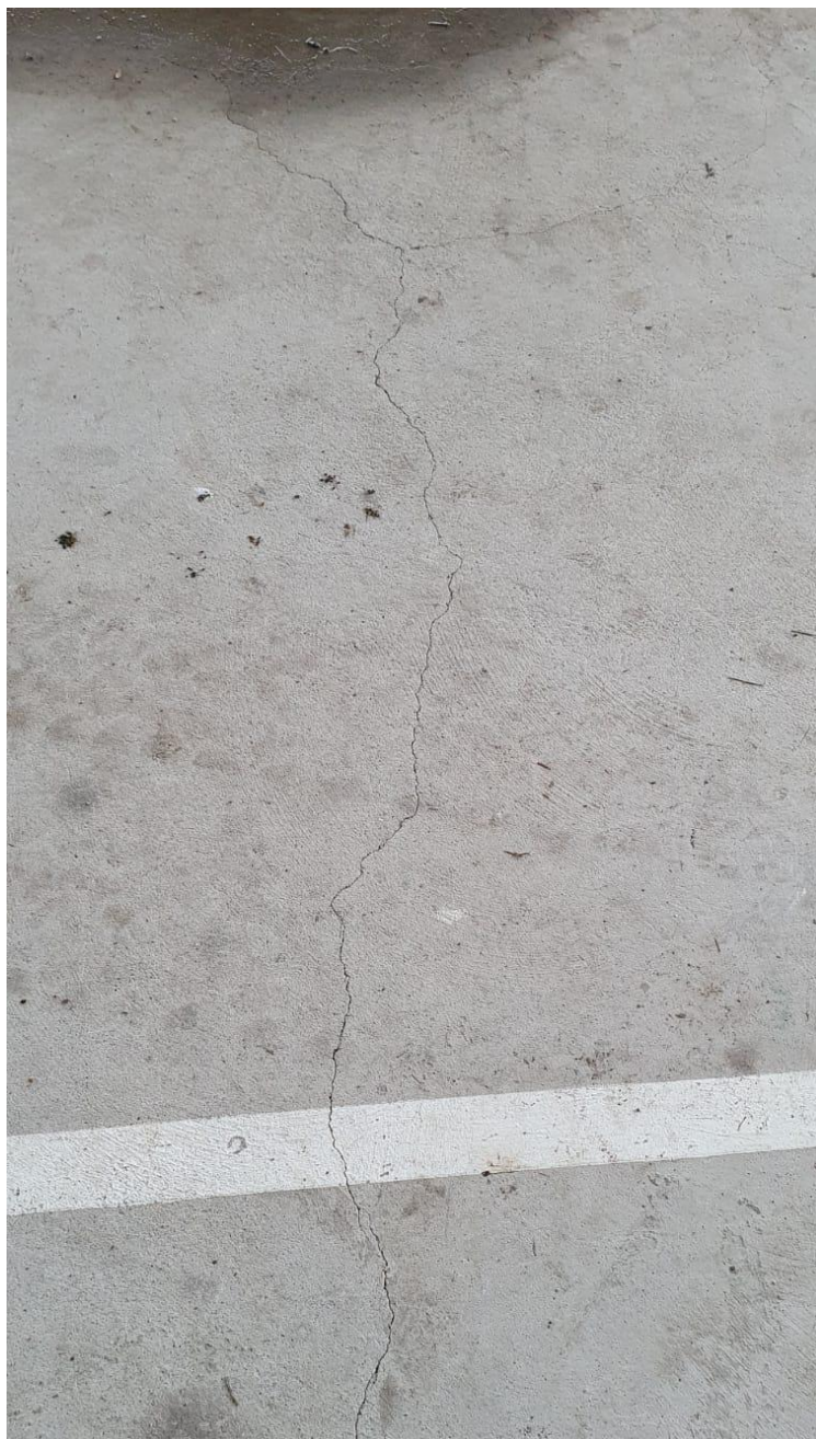
Existe micro fisuras cancha de Pumayacu-Pano