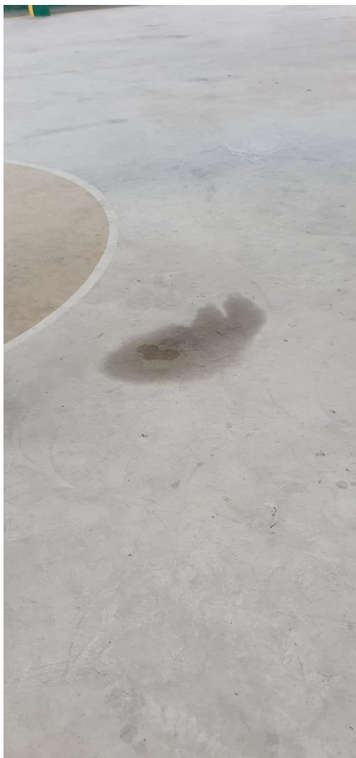
Existen goteras cancha 2 Ríos