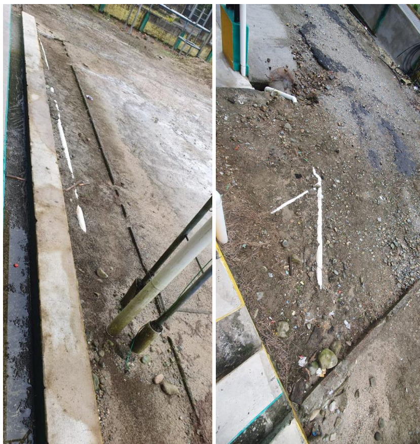
Las tuberías se encuentran vistas cancha de 2 Ríos