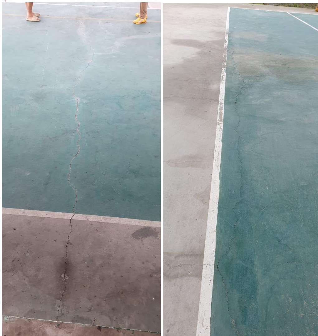
Fisuras en toda la cancha de 2 Ríos